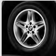
Sternspeiche 74 Seite 6