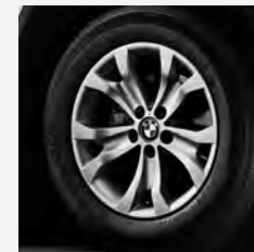
Y-Speiche 183 Seite 6