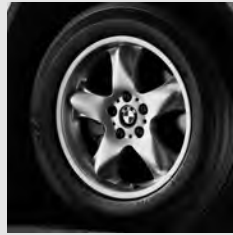
Sternspeiche 58 Seite 7