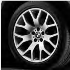
Kreuzspeiche 177 Seite 6