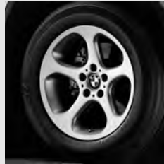
Sternspeiche 69 Seite 7