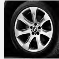
V-Speiche 168 Seite 6