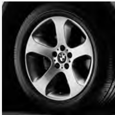
Sternspeiche 132 Seite 6