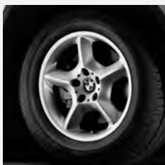
Sternspeiche 57 Seite 7