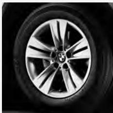
Sternspeiche 153 Seite 6, 7