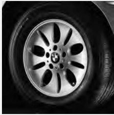
Ellipsoid-Styling 56 Seite 7