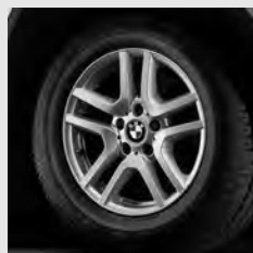
V-Speiche 130 Seite 7