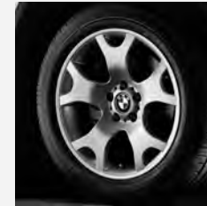
V-Speiche 63 Seite 6