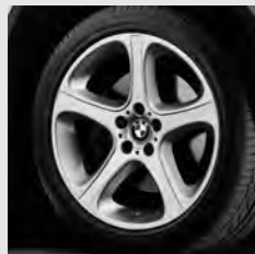
Sternspeiche 87 Seite 6